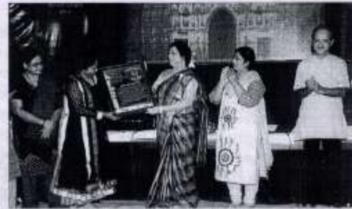
'જામનગર ૨૦૧૪' એવોર્ડ પ્રાપ્તિ

- તેઓશ્રીએ નૃત્યતાલીમ વિવિધ તજજ્ઞ ગુરુજનો પાસેથી પ્રાપ્ત કરી છે. રાષ્ટ્રીય કક્ષાએ સિદ્ધિ પ્રાપ્ત કરેલ છે. તેઓશ્રી પ્રબુદ્ધ નૃત્યાંગ કલાગુરુ, પરીક્ષક, નિર્ણાયક, કોરિયોગ્રાફર, લેખિકા તથા સંચાલિકા તરીકે કાર્યરત છે. 'કલાવિમર્શ'ના નૃત્ય વિભાગના સંપાદક પણ છે.