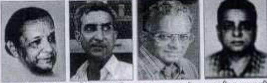
શ્યામ પાલણપુરી સૈક પાલણપુરી ચંદ્રકાન્ત ઢોશી મુસકાર પાલણપુરી